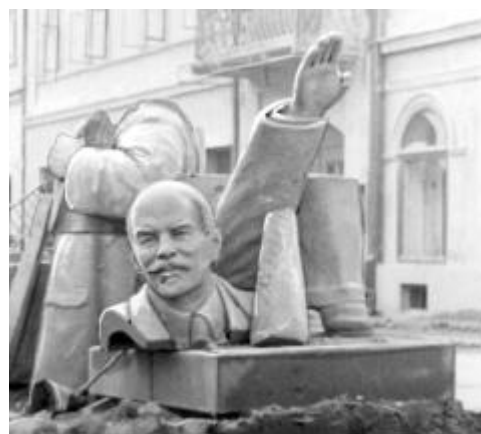
Przemysl – fragmenty pomníka V. I. Lenina v júli 1941

Ani svetového vodcu proletariátu Lenina so zdvihnutou pravicom neváhali v r. 1941 zobrazit' na pamätníku, ako vidno na obrázku vpravo: