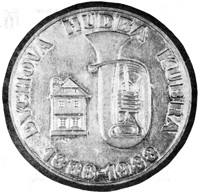
Kubranské medaily a plakety